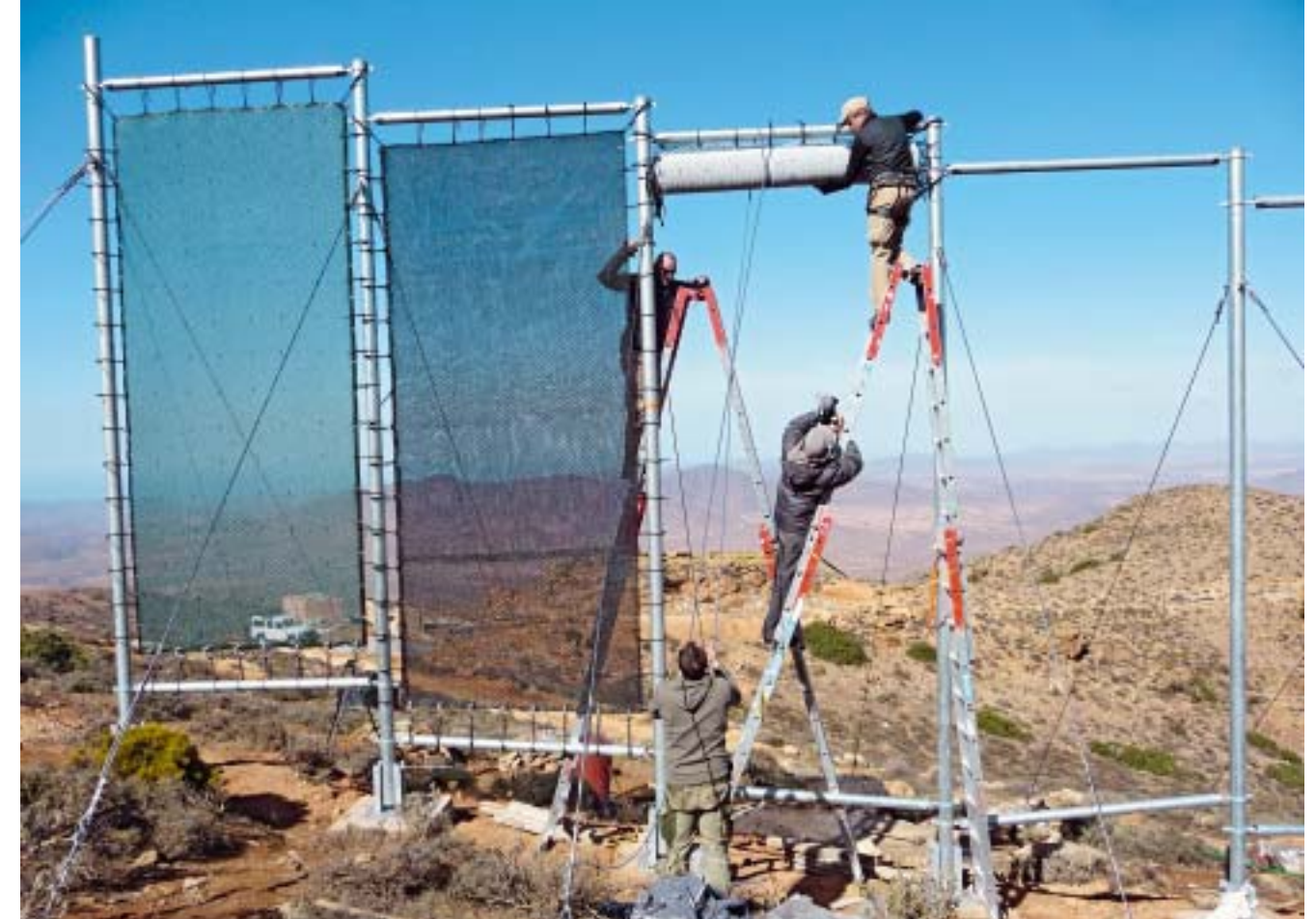
Designer Peter Trautwein lässt von der Spitze der Montageleiter eines der Nebel-Netze herab (oben). Das Gelände der Pilotanlage (r.u.) ist so unwegsam, dass Material teilweise mit Eseln transportiert werden muss (rechts). Die Auswertung des Tests (unten) durch die TU München wird das effektivste Netz ermitteln.

Anders als der Laie erwarten würde , soll die Befestigung des Netzes nicht starr sein, sondern flexibel. Trautwein weiß: Nur wer dem Wind nachgibt, kann ihm widerstehen. Deshalb halten Gummibänder das Netz in Position. Sollte der Wind doch einmal zu stark wehen, dann geben sie so lange nach, bis sie reißen – und nicht das Netz. „Diese Sollbruchstelle ist viel >