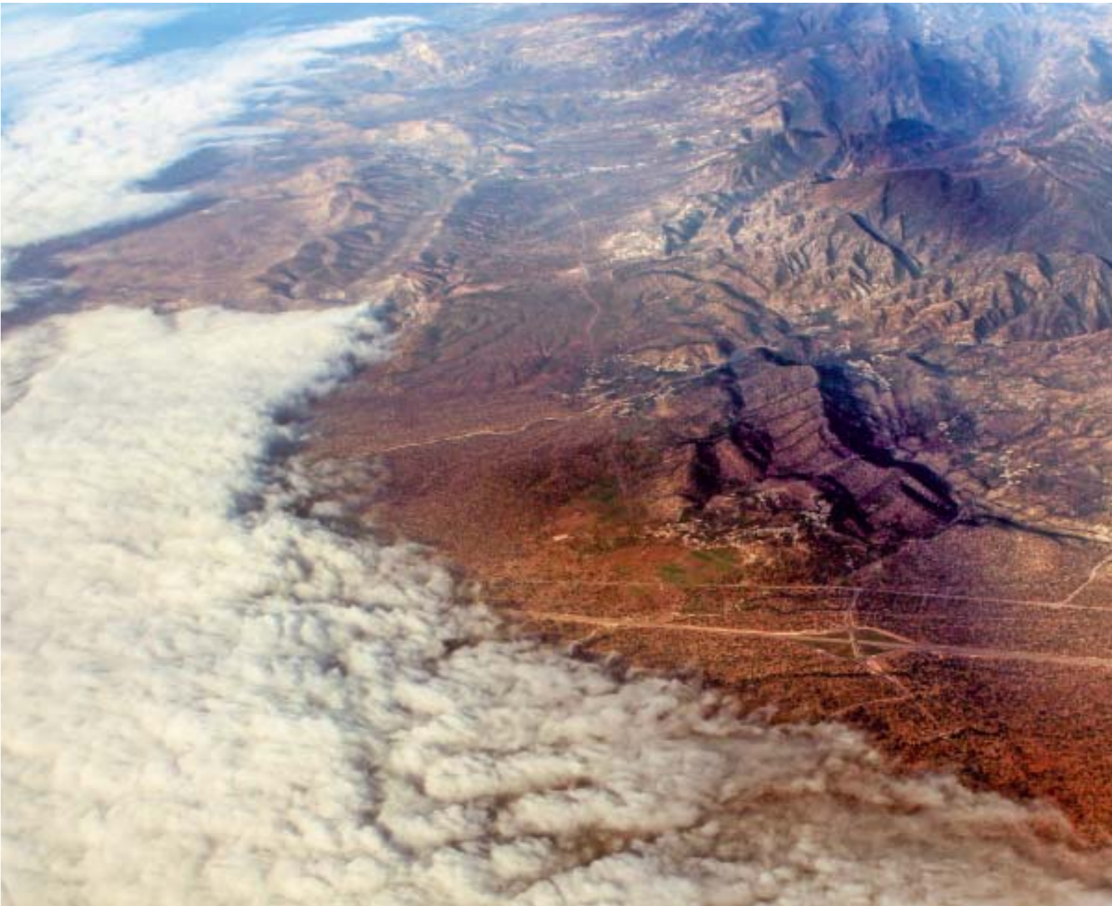
Der Nebel, der von der Atlantikküste im Südwesten Marokkos ins Gebirge zieht, soll Trinkwasser liefern.